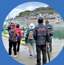
弁天岩 小泊まち歩き