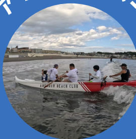
アウトリガーカヌー